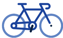
EN TU BICI