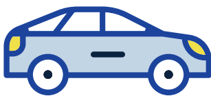
EN TU AUTO